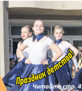
Праздник детства! Читайте стр. 4