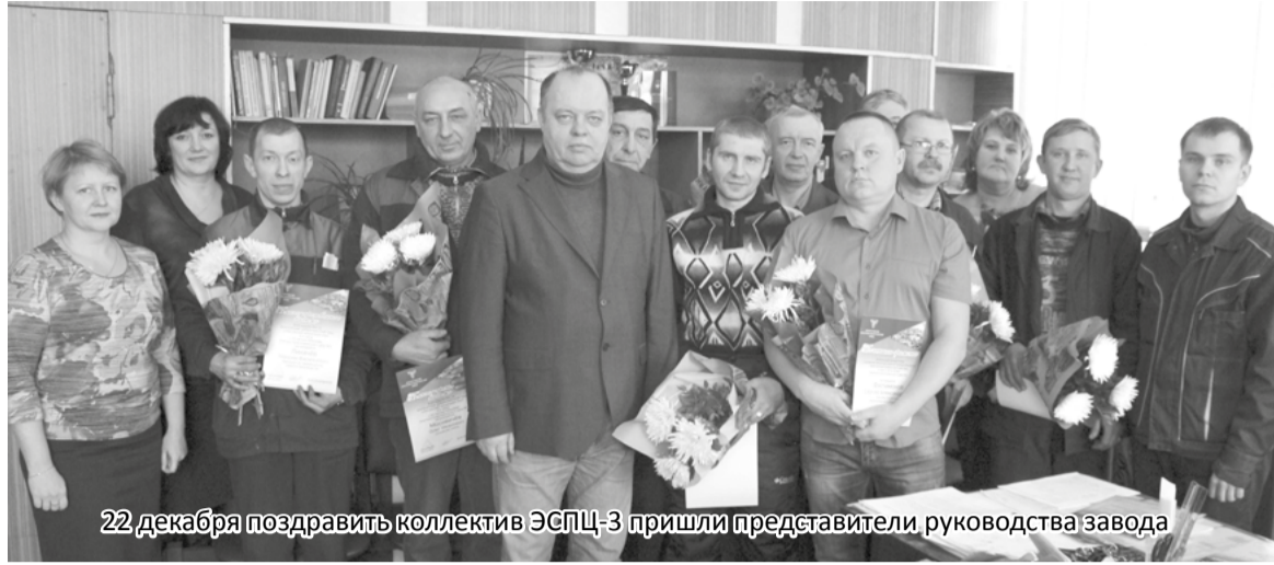
22 декабря поздравить коллектив ЭСПЦ-3 пришли представители руководства завода

29 декабря 1967 года в строй первая очередь электросталеплавильного цеха № 3. С пуском цеха завод стал располагать всеми существующими процессами сталеварения.