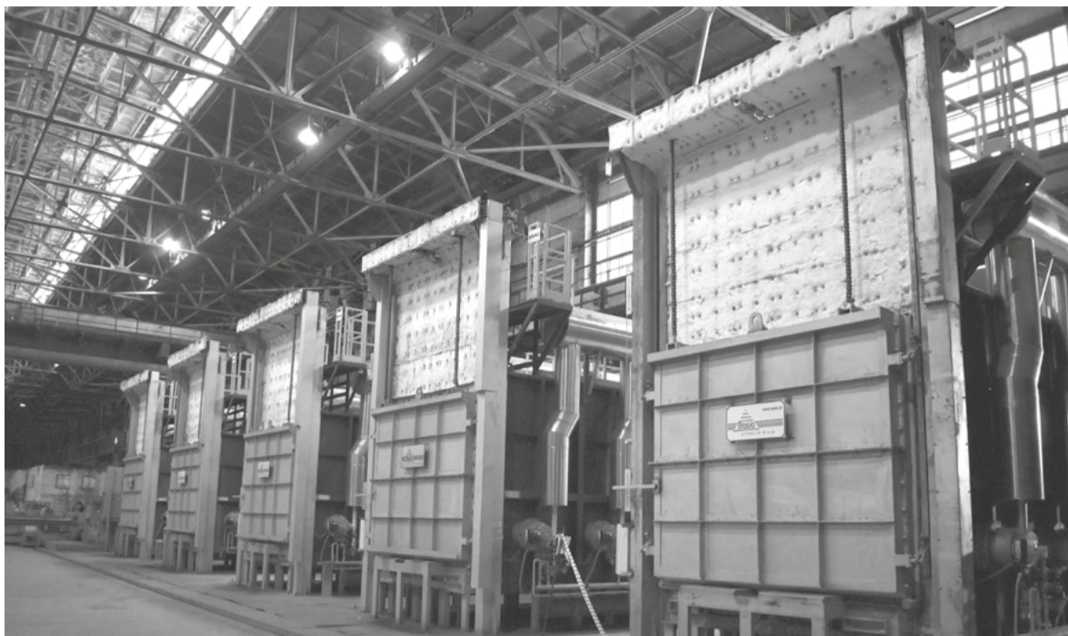
Для справки: печное оборудование нового термического участка предназначено для термической обработки заготовок из углеродистых и легированных сталей. Пять термических камерных печей типа PP-K 23/1000 с максимальной температурой нагрева до 1000° С, установленные на новом участке, используются для нагрева следующих изделий: круга (Ø16-Ø340 x 6000 мм), квадрата (80-550 x 6000 мм) и слябов (160-290 x 500-650 x 1400 мм). Масса садки каждой печи, с учётом подставки, составляет 45 тонн. При среднем режиме работы продолжительностью в 30 часов ежемесячная производительность каждой из печей составляет около 900 тонн.

В начале месяца уже состоялся один из наиболее важных этапов - пробный запуск оборудования с проверкой его систем и агрегатов. Сегодня идёт процесс сушки, который также позволит оценить работу всех систем. Затем, с целью подтверждения качества проведённых строительно-монтажных работ, на печи будет выполнена контрольная термообработка.