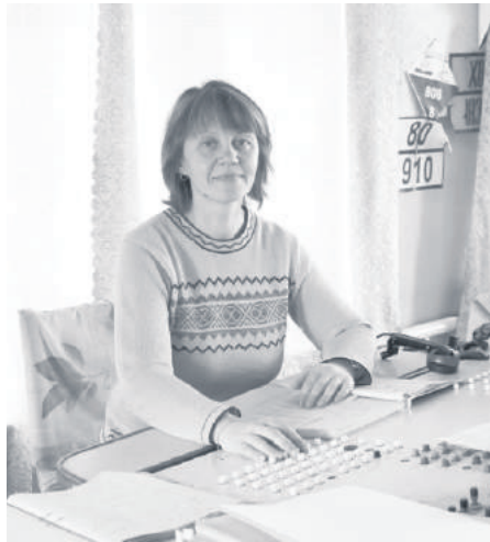
ТВОРЧЕСКАЯ МАСТЕРСКАЯ ДВОРЦА КУЛЬТУРЫ «МЕТАЛЛУРГ». Приём в студии и секции с 01.09.2017 г. Телефон для справок: 69-74-10