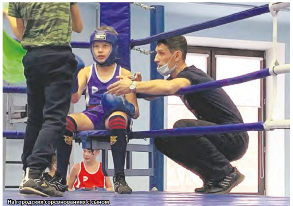
На городских соревнованиях с сыном