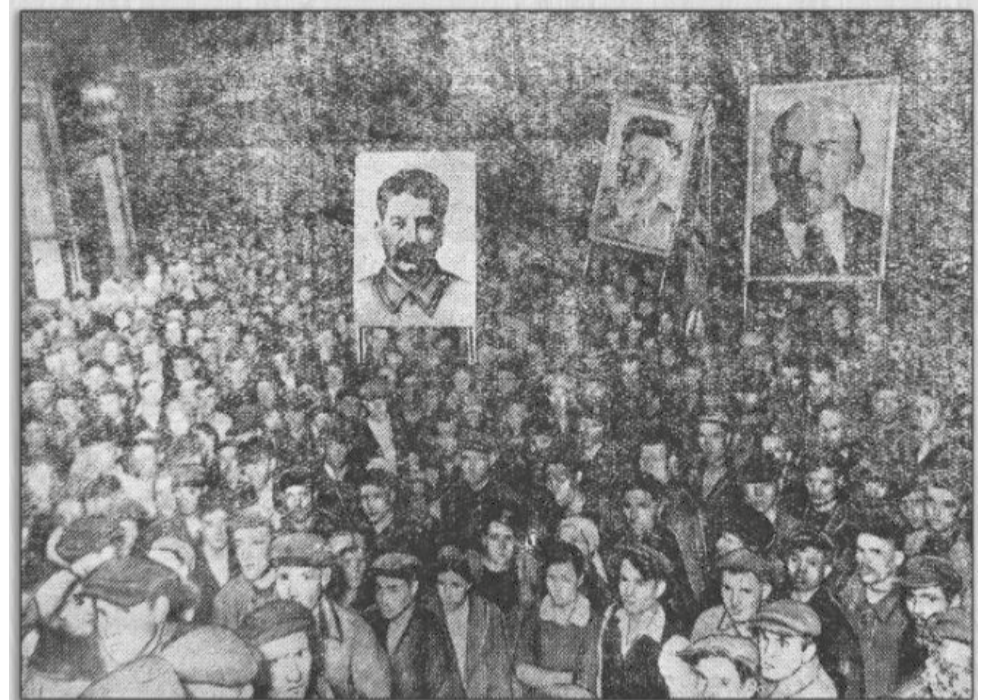
Митинг рабочих, инженерно-технических работников и служащих ночной смены Златоустовского металлургического завода им. И. В. Сталина. 22 июня 1941 г.