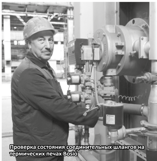
Проверка состояния соединительных шлангов на термических печах Bosio